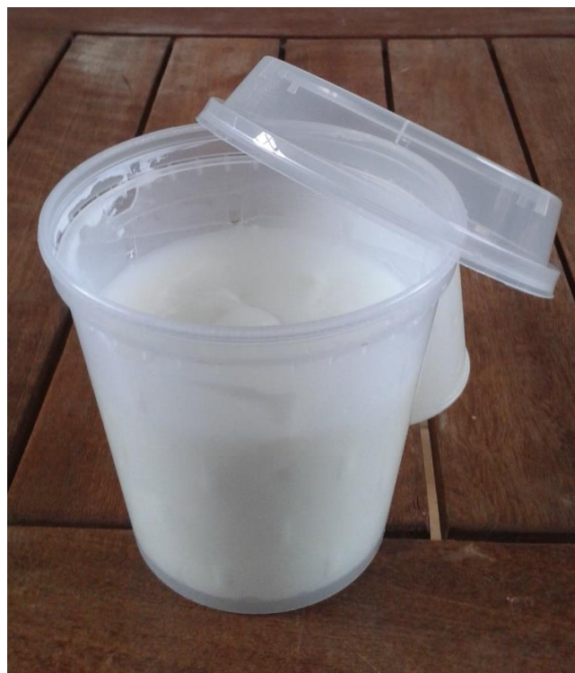
Faisselle, 250 g 3.50 €