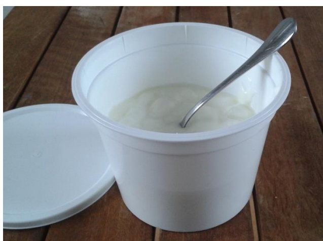
Fromage Blanc, 350 g 3.50 €