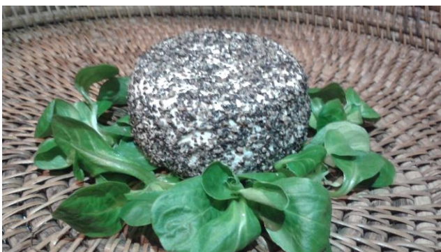
Chèvre au Poivre, 180 g