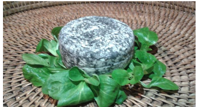
Chèvre Cendré, 180 g