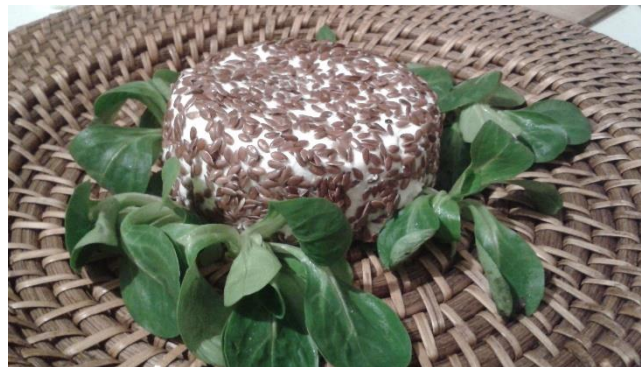
Chèvre Graines de lin, 180 g 3.50 €