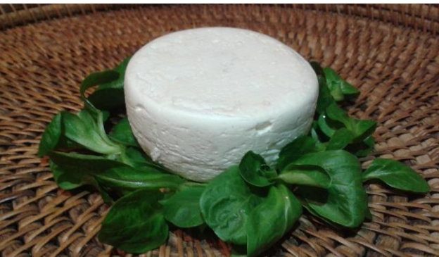
Chèvre Frais, 180 g