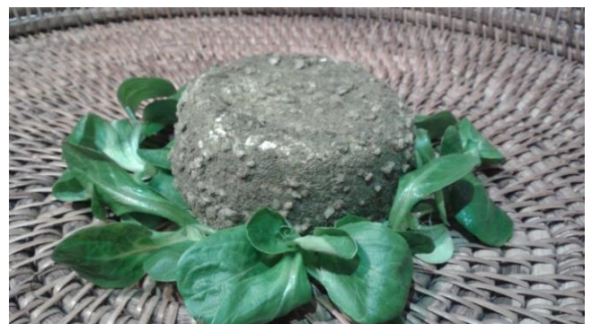
Chèvre aux Herbes, 180 g