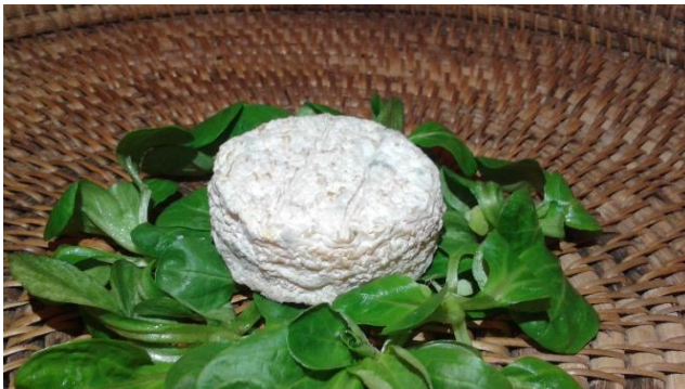
Chèvre Sec, 80 g