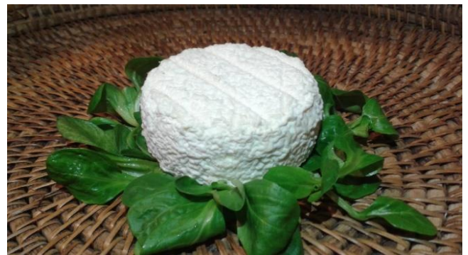
Chèvre Demi-sec, 160 g