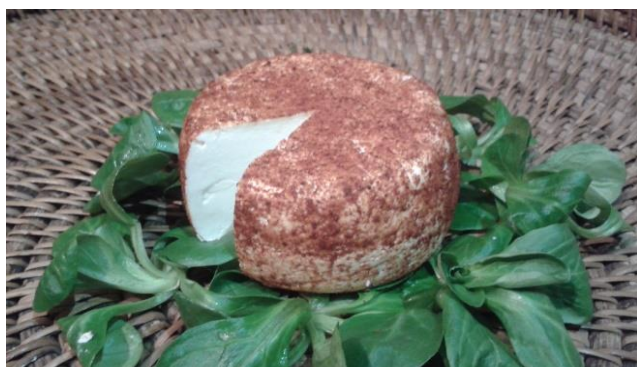
Chèvre au Paprika, 180 g 3.50 €